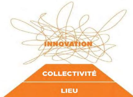
1: Centre for Social Innovation

Un graphique produit par le Centre for Social Innovation (CSI) illustre ces propos de façon très simple : la synergie y est représentée par une série de boucles au sommet de la théorie du changement. On y lit le mot « Innovation ». Le CSI est si certain de ce résultat d'une alliance entre la collectivité et un lieu donné qu'il a repris cette image sur son logo.